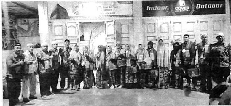
JAMAAH Umrah yang diberangkatkan oleh PT BSM Padangpanjang.