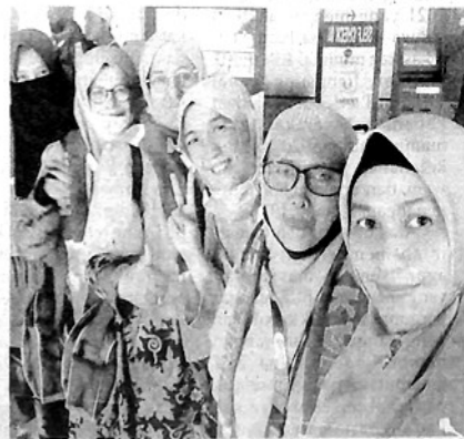
DILEPAS—Sebanyak 23 Orang Warga Padangpanjang dilepas ke Tanah Suci Mekah untuk mengerjakan Umroh.