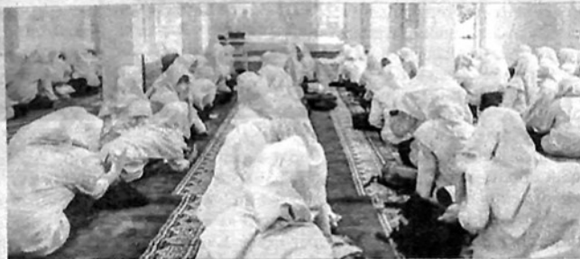
KEGIATAN pembukaan Pesantren Ramadan yang diinisiasi oleh DPD AGPAII Kota Padangpanjang.

"Dengan adanya kegiatan ini, diharapkan dapat memperbaiki spiritual, akhlak, dan keimanan para siswa," katanya yang disaksikan para siswa di berbagai sekolah melalui Zoom Meeting dan Channel Youtube Spenfive TV.